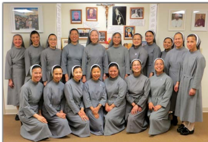
Các Nghị Viên của Tu Nghị Chi Dòng Trinh Vương Hoa Kỳ 2017