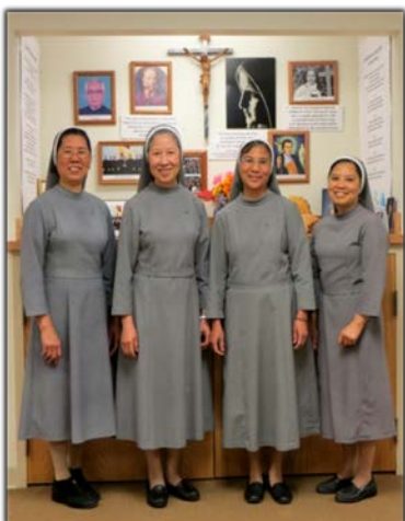
Các Sơ trong Hội Đồng Mới