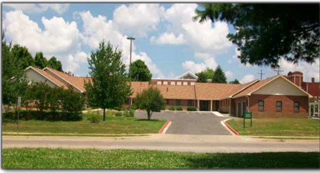
Trụ sở chính của Chi Dòng tại Springfield, Missouri.

KINH LÝ: Hàng năm chị Phụ Trách Chi Dòng có trách vụ đi thăm các cộng đoàn chị em trong Chi Dòng và gặp gỡ những Vị liên quan đến sứ vụ tông đồ của các chị em. Chị thường chu toàn trách vụ này vào Mùa Chay, sau khi nhận được bản lượng định của chị em. Chúng con có 4 tu viện, thuộc về 4 giáo phận khác nhau. Sau dịp kinh lý, Chị sẽ cho chị em trong Chi Dòng biết về nhận định chung của Chị. Chị cũng sẽ gửi bản tường trình hàng năm về Chị Tổng Phụ Trách. Xin tạ ơn Thiên Chúa và Mẹ Maria vì các chị em đều tu tốt, khỏe mạnh và có công việc tông đồ hợp với khả năng; nhất là luôn sống ơn gọi Tu Trì mỗi ngày sung mãn hơn với ơn của Chúa.