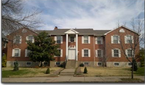
Tu viện và Trường Tập tại St. Louis, Missouri

KINH LÝ: Hàng năm chị Phụ Trách Chi Dòng có trách vụ đi thăm các cộng đoàn chị em trong Chi Dòng và gặp gỡ những Vị liên quan đến sứ vụ tông đồ của các chị em. Chị thường chu toàn trách vụ này vào Mùa Chay, sau khi nhận được bản lượng định của chị em. Chúng con có 4 tu viện, thuộc về 4 giáo phận khác nhau. Sau dịp kinh lý, Chị sẽ cho chị em trong Chi Dòng biết về nhận định chung của Chị. Chị cũng sẽ gửi bản tường trình hàng năm về Chị Tổng Phụ Trách. Xin tạ ơn Thiên Chúa và Mẹ Maria vì các chị em đều tu tốt, khỏe mạnh và có công việc tông đồ hợp với khả năng; nhất là luôn sống ơn gọi Tu Trì mỗi ngày sung mãn hơn với ơn của Chúa.