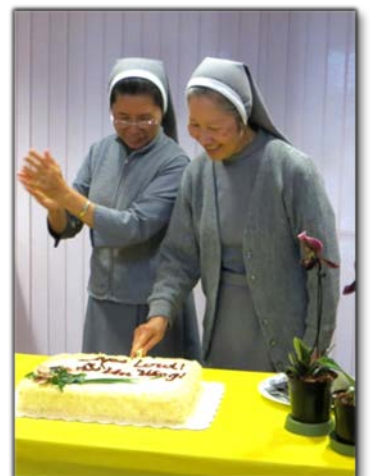
Chị em cùng cắt bánh chung vui