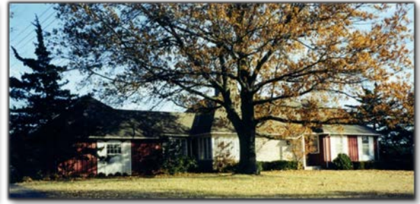
Tu viện Tông đồ tại Kansas City, Missouri.