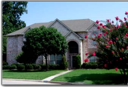
Tu viện và Trường Đệ Tử tại Irving, Texas